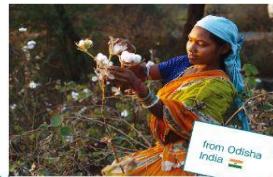
from Odisha India

サシャは、1978年の創立以来、特に立場の弱い女性を対象に、市場の開拓やデザインの開発に力を入れ、地域固有の手仕事文化を発展させ、生産者たちの生きる道を作り出しています。