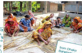
from Dhaka Bangladesh

ノアズアークの活動は、伝統的な手工芸の盛んなインド、モラダバードの職人たちと「力」ではなく「信頼」の関係を築いて、伝統的な手工芸文化を残していくことを目指しています。