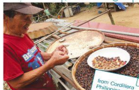
from Cordillera Philippines

ミトラバリはバリ島で生産者たちの立場が弱い状況を改善させるために設立され、商品開発や技術支援、マーケティング、生産者たちの健康管理や安全管理など、さまざまな面で社会的に弱い立場の生産者たちの暮らしをサポートしています。