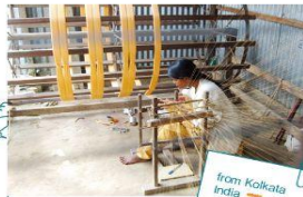
from Kolkata India

MESHは「Maximizing Employment to Serve the Handicapped」の略で、「ハンセリ患者者と障害者のための就業機会を最大化すること」を目的に活動しているインドのNGOです。