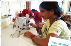
from Mumbai India

DEW Craftsは、 Bangladesh の最貧困家庭が自力で貧困から抜け出せるようにと、1996年に貧困対策の専門家集団が設立しました。ホグラという水辺で採れる植物を使ったバスケット作りで、人々が将来に夢を持ち、尊厳のある人生を歩む助けとなっています。