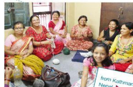
from Kathmandu Nepal

CCAPは、フィリピンの自然素材を使った手工芸品を生かして、貧困を改善することを目的に1973年に設立されました。CCAPは、フィリピン各島に散らばる生産者グループに対し、組織運営の指導や融資など、自立への支援を行っています。