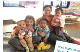
from Kathmandu Nepal

サナハスタカラは、ネパールの言葉で「小さな手工芸品」を表します。電力や水など資源不足が慢性化しているネパールでは、手仕事の技術を活かすことが重要です。編み物や織物、フェルト小物、焼き物などは、すべて手仕事で丁寧に生産されています。