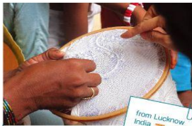
from Lucknow India