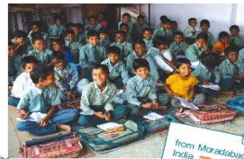
from Moradabad India

農家の健康と生活、そして環境を守るために、在来の種を使ったオーガニックコットン栽培に加え、コットンだけに頼らない「飢えない農業」を推進しているNGOです。