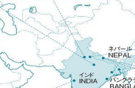
from Bangkok Thailand

クリエイティブハンディクラフトは、ムンバイのスラムに暮らす人々を支えるため、女性たちによる小さな縫製グループを作り、技術指導や国内外での販売支援をしています。