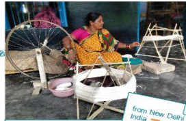
from New Delhi India

カラディマクが活動するインド中北部のラクノーは、400年の歴史を持つ、チカン刺繍と呼ばれる美しい手刺繍の技術が、母から娘へと受け継がれている地域です。