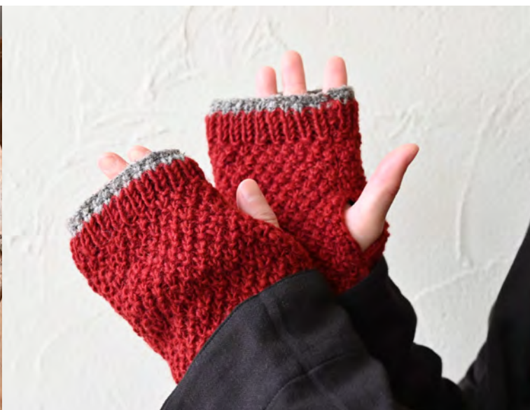
26ASN2309 カノコアームウォーマー (RD)