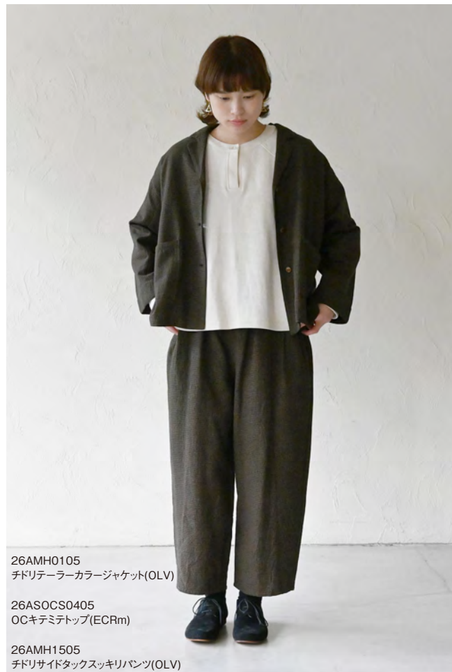
26AMH0105 チドリテラーカラージャケット(OLV)