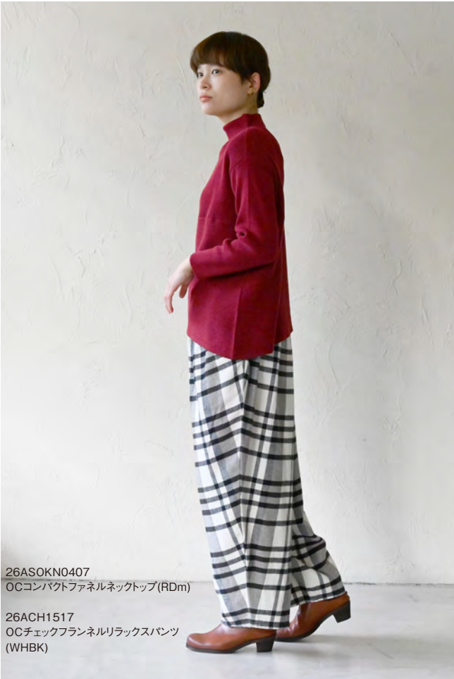
26ASOKN0407 OCコンパ ® クトファネルネックトップ (RDm)