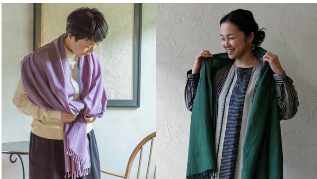
( 下段 ) 26ASSH2121 手織 OC ワイドストール (PP・GR)