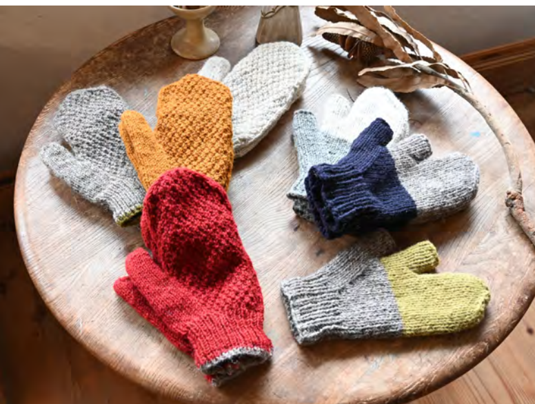
26ASN2315 カノコミトン (RD・MT・GBR・GWH) 26ASN2317 ナマステミトン (GRBR・BRNV・WHGY)